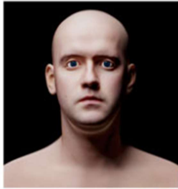
Soft light... gentle transitions between light and dark