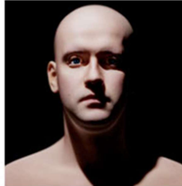
Hard light... harsh, sharp lines with little or no transition from light to dark.

Hard Light ගැඹුරු සෙවණැලි ඇතිකරන අතර Soft Light මඟින් එම සෙවණැලි ඇති නොවේ. Hard Light ඇතිකරන තියුණු සෙවණැලි දෙස ප්‍රේක්ෂකයාට දිගු වෙලාවක් ඒ දෙස බලා සිටීමට නොහැකිය.