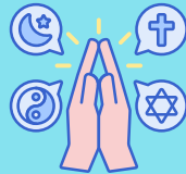
Comunidades de ejercicio de la libertad religiosa