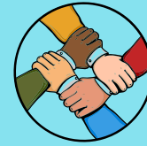
Sindicatos y organizaciones de trabajadores