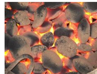
Briquettes de charbon