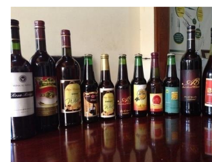
Vin de banane