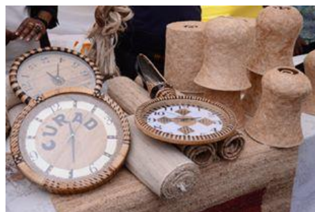
Textiles et Artisanat