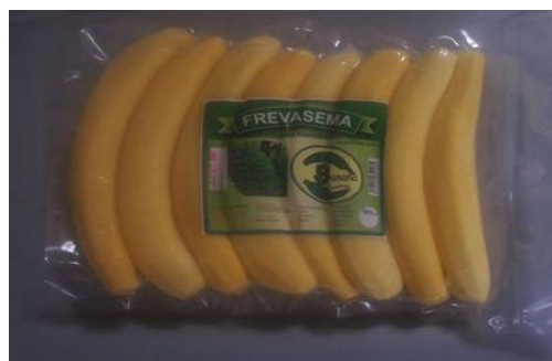
Bananes fraîches sous scellées