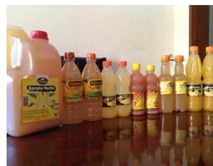
Jus de banane